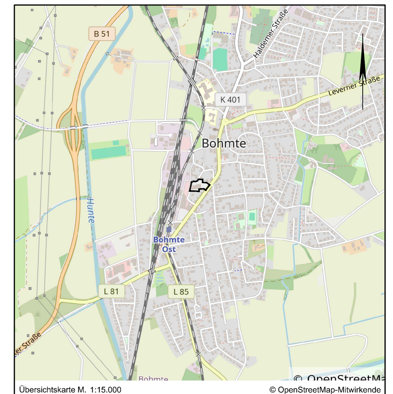
Übersichtskarte M. 1:15.000 © OpenStreetMap-Mitwirkende