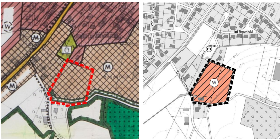
Abbildung 3: Flächennutzungsplan Anpassung im Wege der Berichtigung für die Aufstellung des Bebauungsplanes Nr. 112 „Südliches Brookfeld“

Im Zuge der Aufstellung des Bebauungsplanes Nr. 112 „Südliches Brookfeld“ ist der Flächennutzungsplan berichtigt worden. Die Berichtigung stellt im Bereich der südöstlich gelegenen „Gemischten Bauflächen“ „Wohnbauflächen (Planung)“ dar.