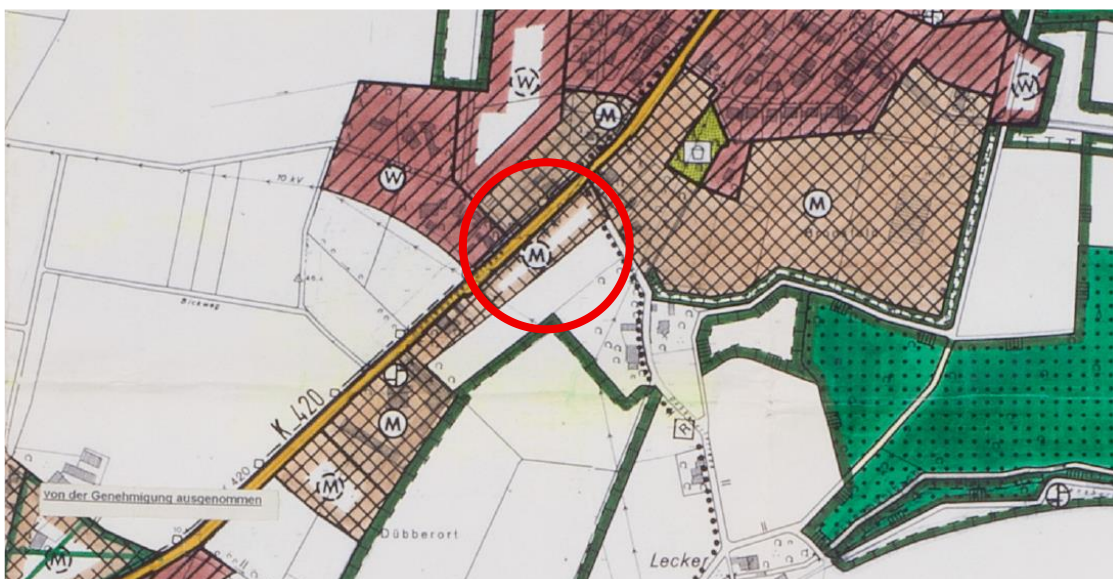
Abbildung 2: Ausschnitt aus dem Flächennutzungsplan der Gemeinde Bohmte

Der Flächennutzungsplan (FNP) dient gemäß § 1 Abs. 5 in Verbindung mit § 5 Abs. 1 BauGB dazu, eine geordnete städtebauliche Entwicklung und Ordnung sowie eine dem Wohl der Allgemeinheit entsprechende sozial gerechte Bodenordnung zu gewährleisten. Der Bauleitplan soll die bauliche und sonstige Nutzung der Grundstücke nach den voraussehbaren Bedürfnissen der Gemeinde vorbereiten und in den Grundzügen darstellen.