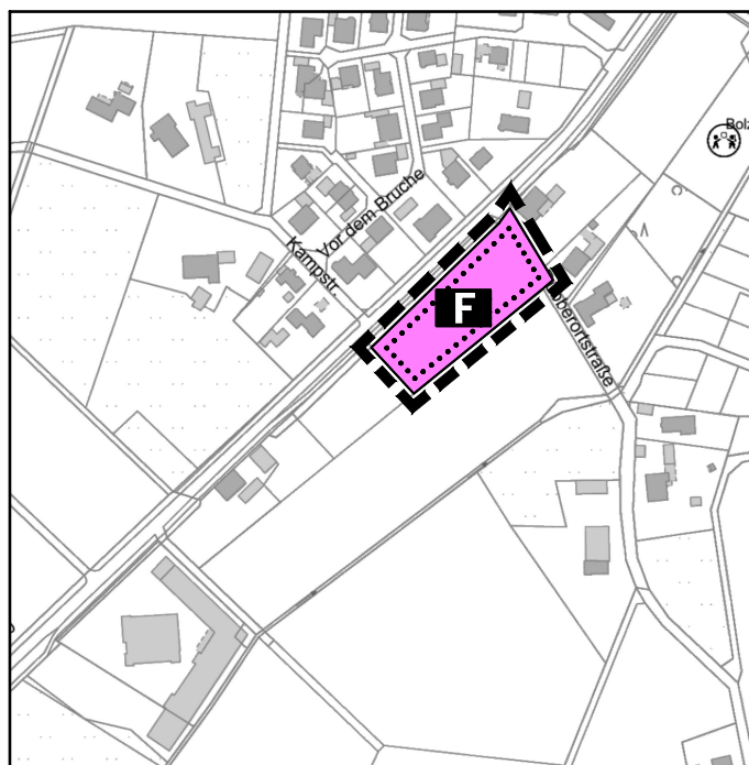
28. ÄNDERUNG DES FLÄCHENNUTZUNGSPLANES M. 1:5.000