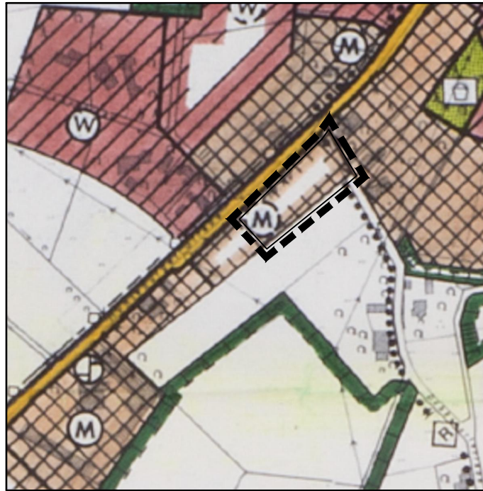
WIRKSAMER FLÄCHENNUTZUNGSPLAN (vom 30.11.1997) M. 1:5.000