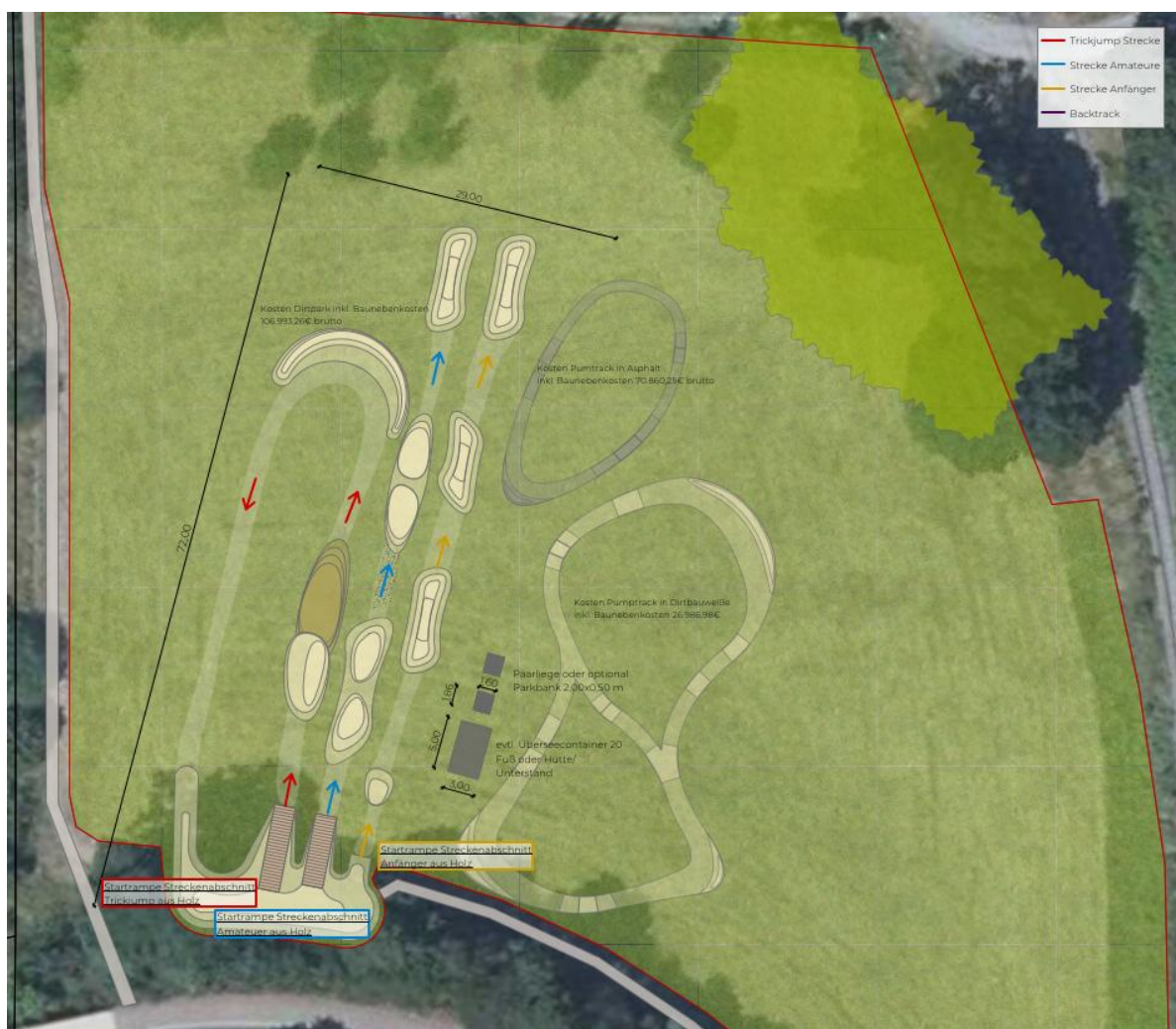
Erschließungskonzept © Die Grünplaner Landschaftsarchitekten

Für den Dirtpark sind drei Strecken mit verschiedenen Schwierigkeitsgraden (Trickjump, Amateur, Anfänger) vorgesehen. Gestartet wird die Fahrt jeweils von Startrampen aus Holz. Die Fahrtstrecke sowie die Sprünge werden aus natürlichen Materialien (Boden, Sand) hergerichtet, sodass durch die Fahrtstrecke keine Versiegelung erforderlich wird. Auf den Flächen außerhalb der Fahrtstrecken soll Rasen angesät werden.