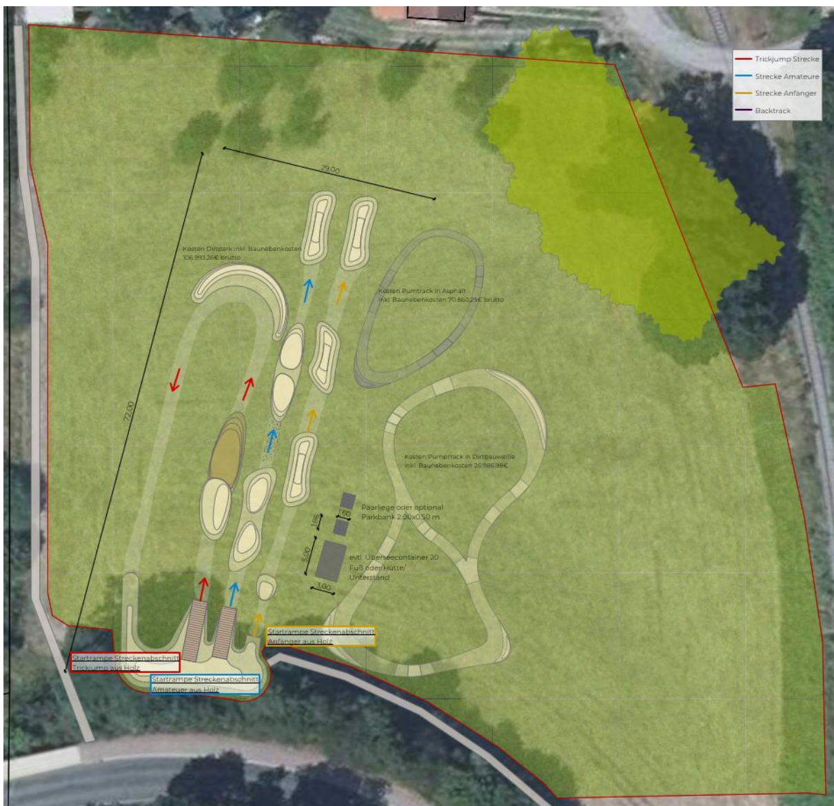
Erschließungskonzept © Die Grünplaner Landschaftsarchitekten

Für den Dirtpark sind drei Strecken mit verschiedenen Schwierigkeitsgraden (Trickjump, Amateur, Anfänger) vorgesehen. Gestartet wird die Fahrt jeweils von Startrampen aus Holz. Die Fahrtstrecke sowie die Sprünge werden aus natürlichen Materialien (Boden, Sand) hergerichtet, sodass durch die Fahrtstrecke keine Versiegelung erforderlich wird. Auf den Flächen außerhalb der Fahrtstrecken soll Rasen angesät werden.