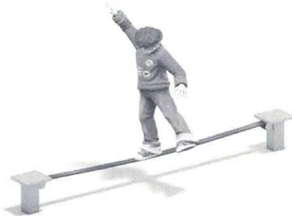
Outdoor Slackline Ständer